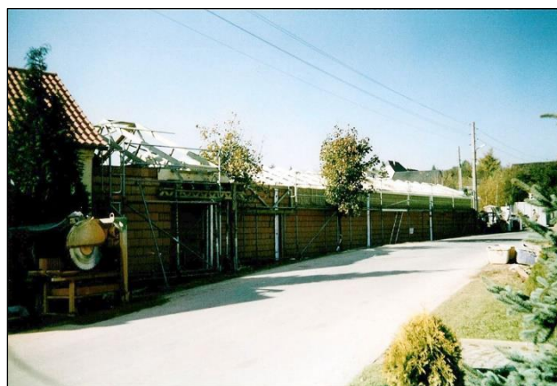
Der Dachstuhl ist gesetzt

Übrigens: Die alte portable Drespo-Volkssport-kegelbahn kostete 1980 6.836,93 Mark. Und bereits im Jahre 1978 war geplant, das Gebäude der Kegelbahn abzutragen. Stattdessen sollte ein zweigeschossiger Neubau erfolgen. Die Kostenschätzung belief sich damals auf 158.000 Mark. Dies dürfte wohl der Grund gewesen sein, weshalb das Projekt nicht realisiert wurde.