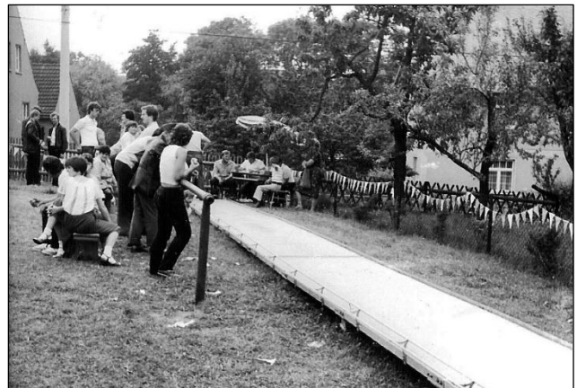
Hammelkegeln zum Dorffest

Ende Juli 1997 begannen der Gemeindegärtner, der Zivildienstleistende und die in einer Arbeitsbeschaffungsmaßnahme Beschäftigten mit dem Abriss der alten Kegelbahn. Sie diente jahrelang dem Kegelverein als Domizil und die portable Bahnanlage wurde zu den jährlichen Dorffesten zum Hammelkegeln auf der Festwiese unterhalb der Kirche aufgebaut.