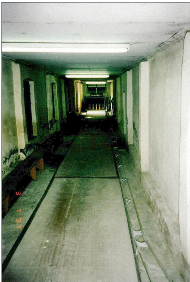
Die alte Kegelbahn