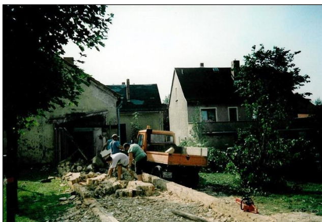
Abtragen der alten Mauern