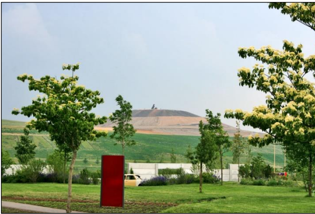
BUGA 2007 in Ronneburg und Gera