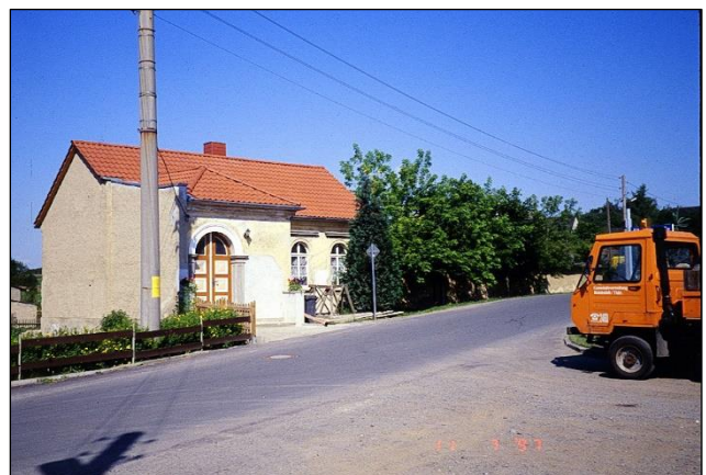
Gemeinderaum mit Kegelbahn