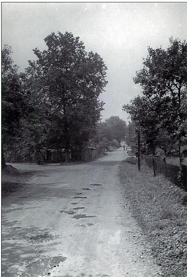
Die Hauptstraße am Abzweig nach Kakau im Jahre 1968...