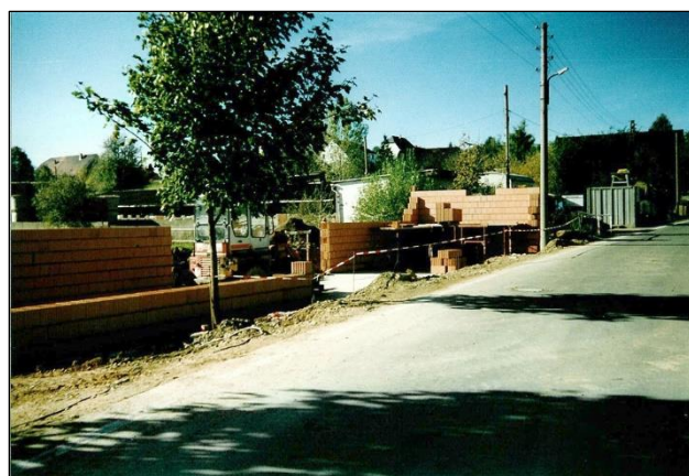
Rohbau der neuen Kegelbahn